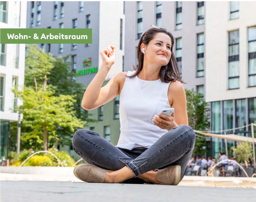
Wohn- & Arbeitsraum