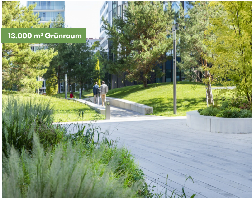
13.000 m 2 Grünraum